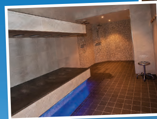
Horisontalduschen i Spa Suite