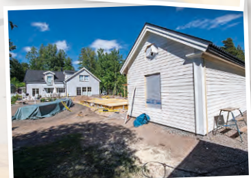
Gäststugan i förgrunden, med poolen bakom.